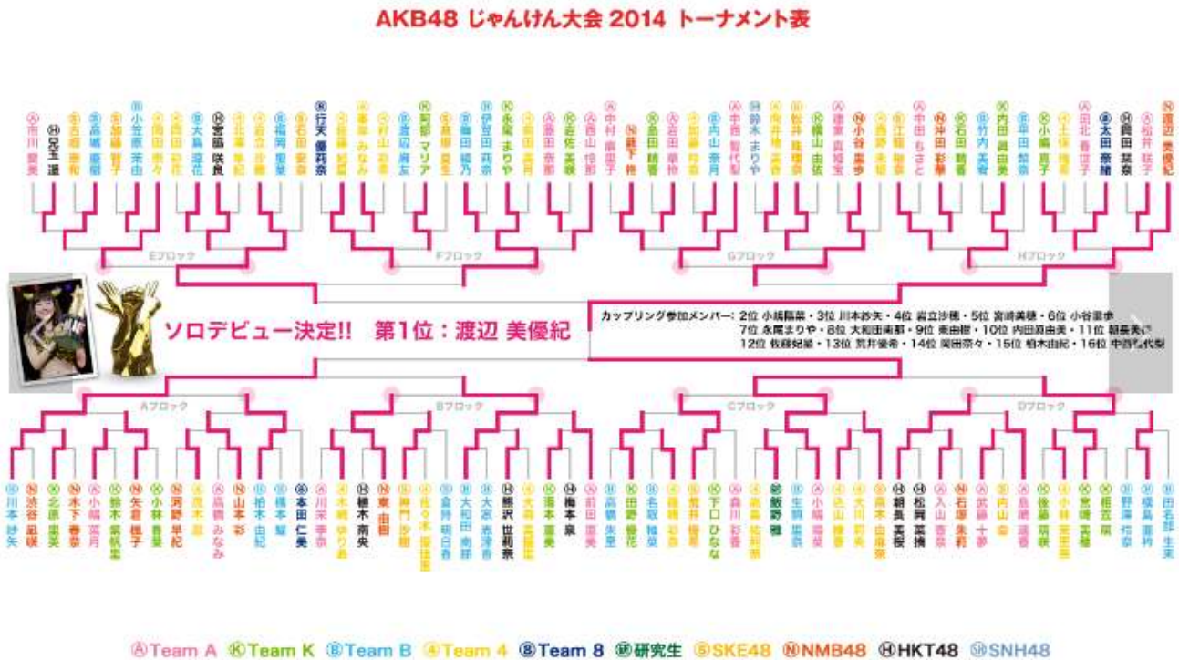
(図) 2014年9月17日に開催された大会のトーナメント表